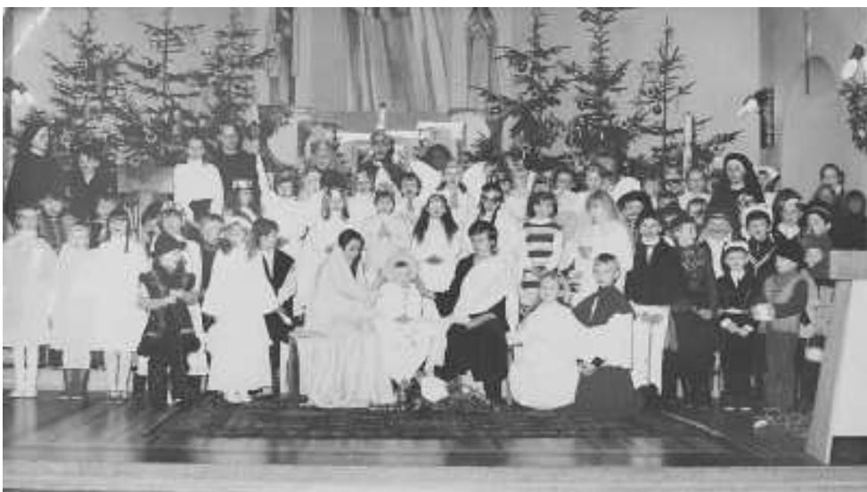
fot: Jasełka w naszej parafii - lata osiemdziesiąte

Dzieci z Turzyczki : na melodię „Dzisiaj w Betlejem” Dzieci z Turzyczki, dzieci z Turzyczki kolebkę przyniosą, również trzewiczki, również trzewiczki byś nie chodził bosy Jezuniu drogi, chociaż mróz srogi, Twe boscie nogi