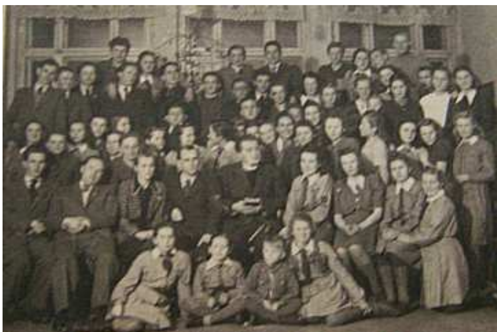
fot. Spotkanie opłatkowe młodzieży w Zamku - rok 1947

Chłopcy : na melodię „Wśród nocnej ciszy” Zostańże z nami o Dziecię Boże