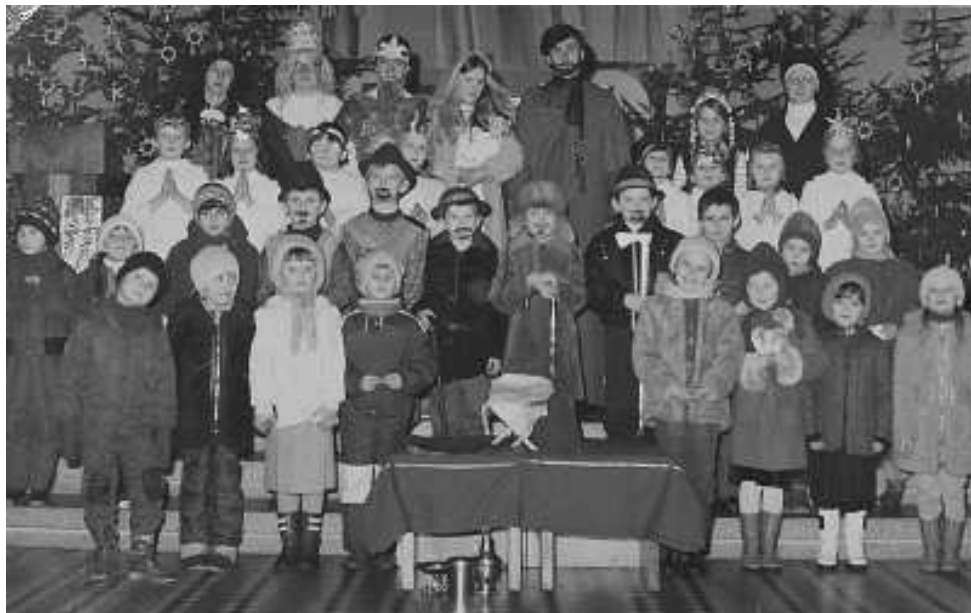
fot: Jasełka w naszej parafii - lata osiemdziesiąte

Jezuniu drogi, trzewiczki otulą, a Ciebie Matula ukołysze w naszej huli.